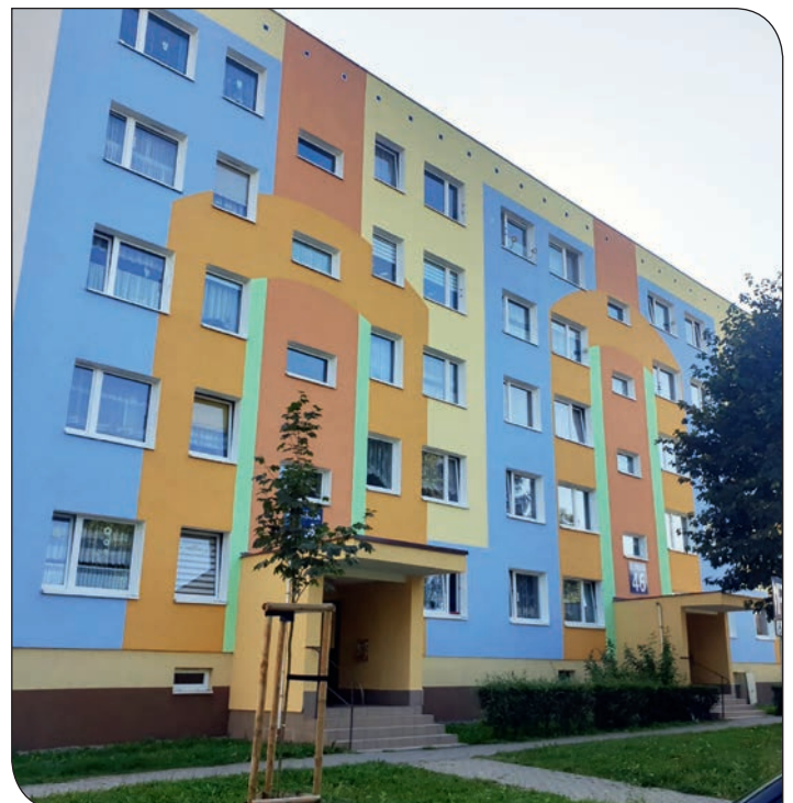
nowa elewacja - Staszica 44-48