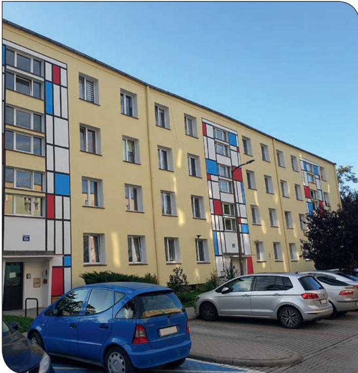
Kolorowe 16 - po malowaniu elewacji

tujący. Zwieńczeniem całego procesu jest malowanie elewacji silikonową farbą z nowoczesnymi środkami zapobiegającymi przed ponownym porażeniem powierzchni elewacji glonami.