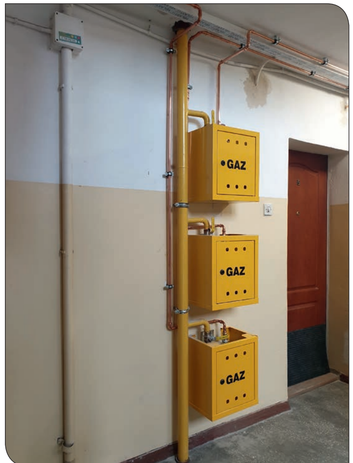
os. Błękitne 24 - nowa instalacja gazowa