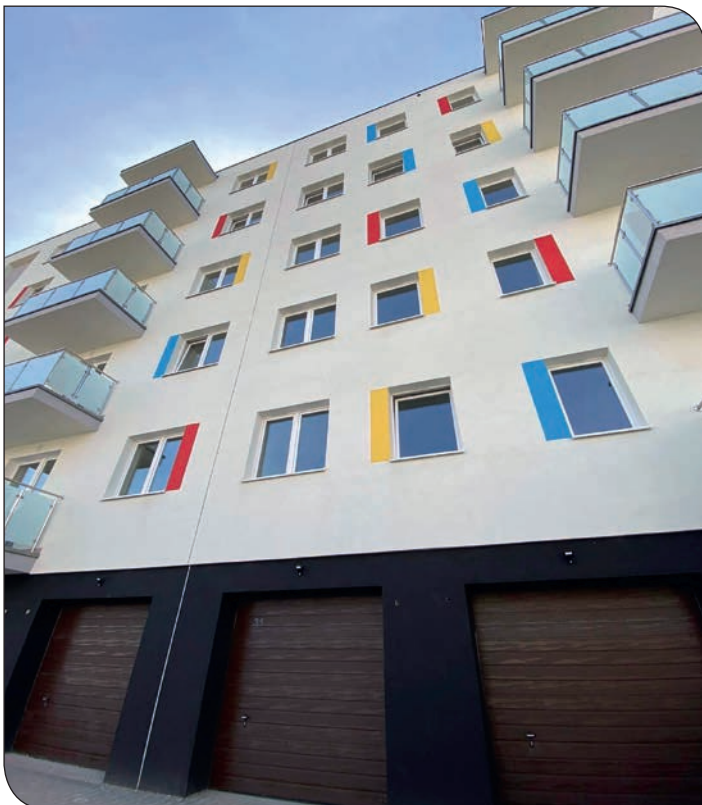
nowy budynek Piława Górna

dowe, w każdej z nich znajduje się winda, a także 12 garaży.