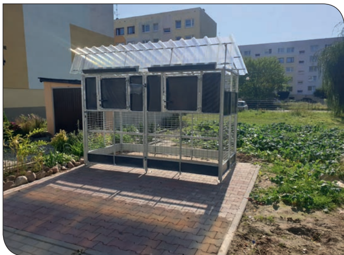
boks śmietnikowy - Różane 4

24,25,26. Boks został posadowiony na podbudowie wykonanej z kostki.