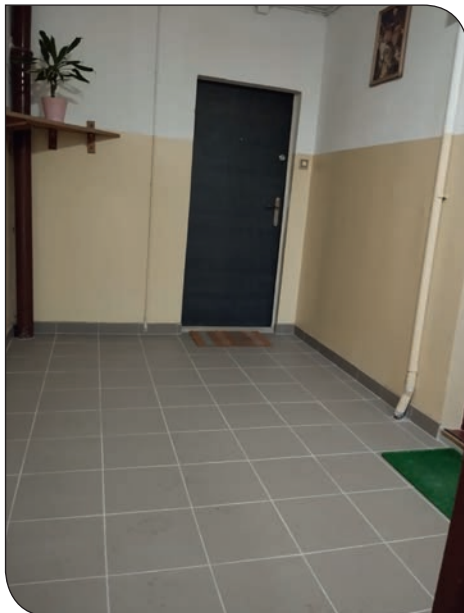
Tęczowe 12 po remoncie klatki schodowej