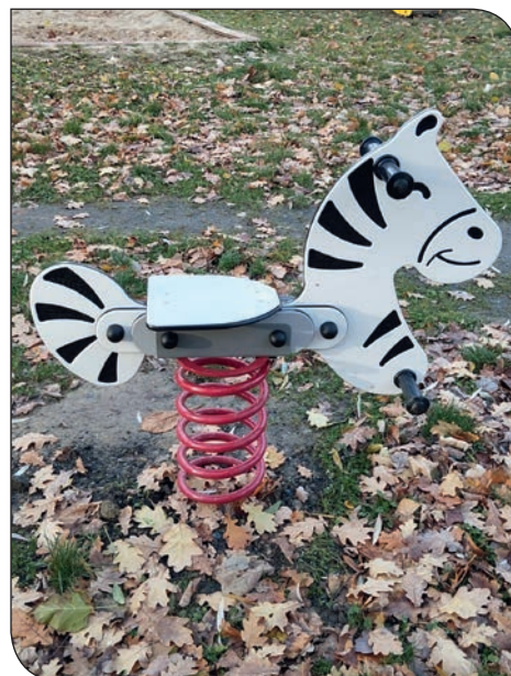
plac zabaw os. Tęczowe