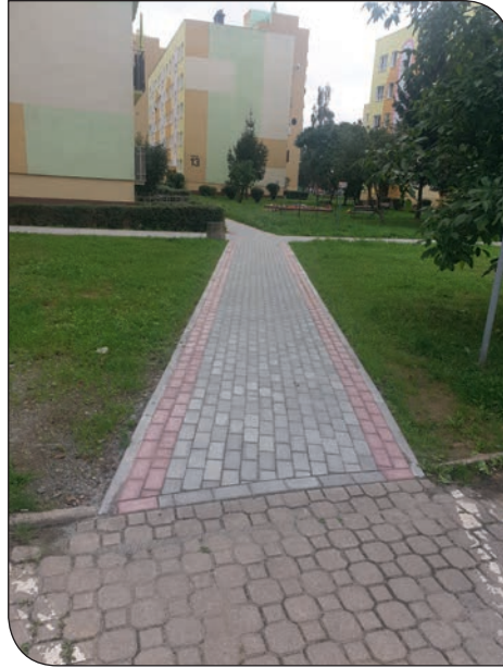
nowy chodnik os. Różane 12-15