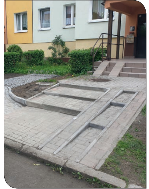
nowy chodnik Różane 39-40