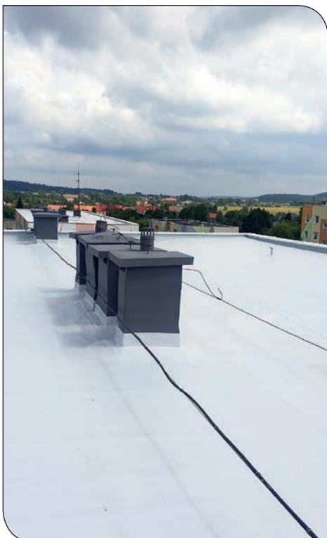
dach po remoncie ul. Staszica 38-42