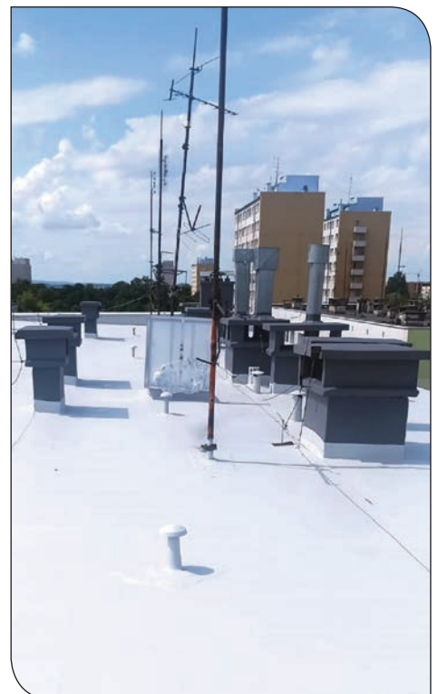
dach os. Jasne 10 - po remoncie