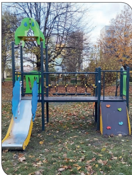
plac zabaw os. Tęczowe