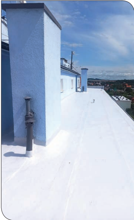
dach os. Jasne 18 po remoncie

skich, remont ścian kominowych lub ich renowacja, renowacja czap kominowych oraz wymiana wyłazu dachowego na nowoczesny wyłaz systemowy z kopułą poliwęglanową.