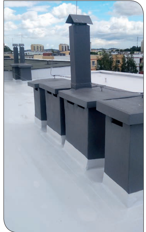
Tęczowe 5 - dach po remoncie