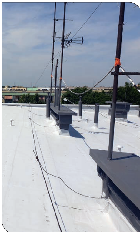
Błękitne 4 - po remoncie dachu