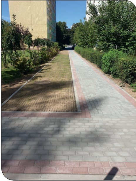
nowy chodnik os. Jasne 16

osiedlu Jasnym 17 w stronę budynku na osiedlu Jasnym 2 aż do budynku na osiedlu Jasnym 4.