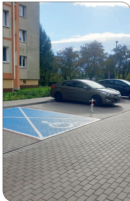
parking ul. Andersa