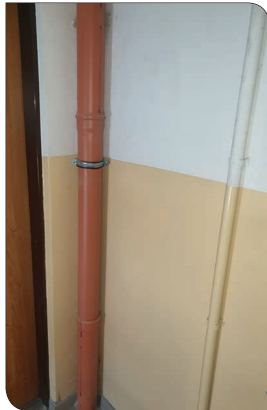
po remoncie kanalizacji deszczowej