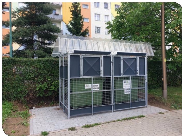
boks śmietnikowy Różane 24-26