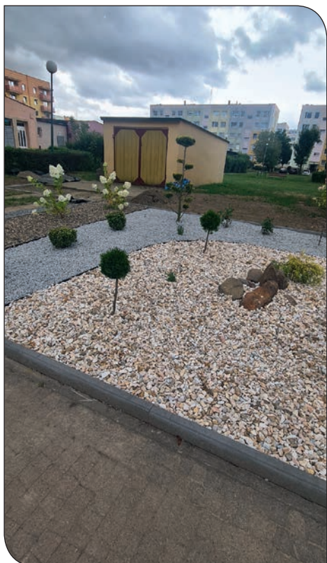
Różane 9 - nowe nasadzenia

budynku, wykonano miejsca na stojaki rowerowe.