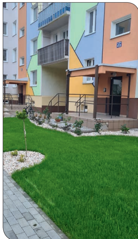
Różane 39-43 - nowe nasadzenia