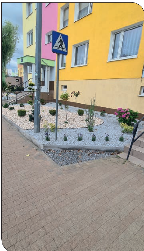
Różane 9 - nowe nasadzenia