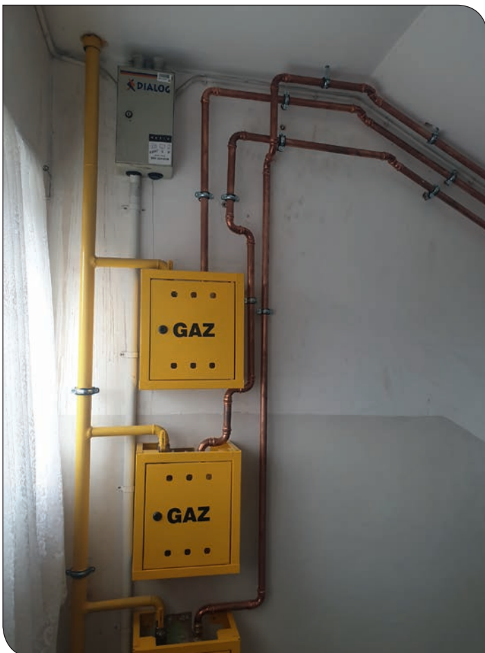
Brzegowa 1 - nowa instalacja gazowa