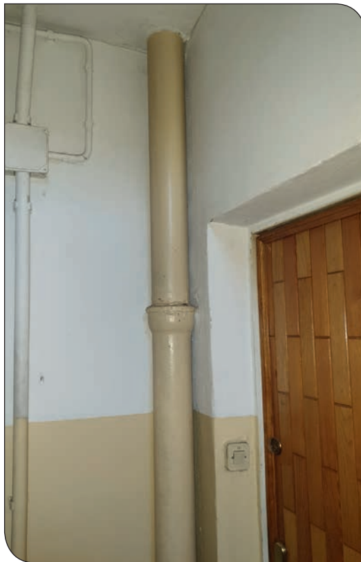
przed remontem kanalizacji deszczowej

W budynku na os. Różanym 1 zakończono wymianę pionów zimnej wody.