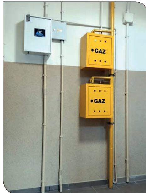
Błękitne 20 - po remoncie klatki schodowej