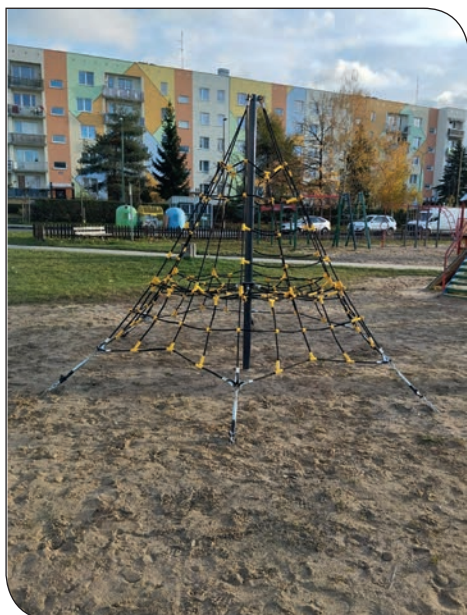
plac zabaw os. Różane

Na osiedlu Tęczowym na placu zabaw przy blokach 22, 23 i 24 zamontowano karuzelę-młynek i duży modułowy zestaw zabawowy.