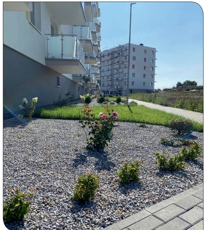
nowy budynek Piława Górna