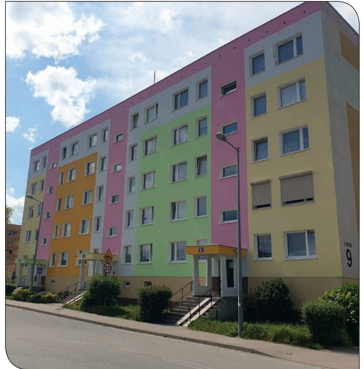
Różane 9 elewacja po remoncie