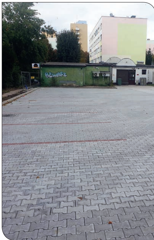
os. Jasne - nowy parking

Na osiedlu Jasnym między budynkami nr 9 i 11 powstał parking z 20 miejscami postojowymi dla samochodów osobowych oraz z 2 miejscami parkingowymi dla osób niepełnosprawnych. Nawierzchnia parkingu wykonana jest z kostki betonowej o grubości 8 cm, dodatkowo wykonano kanalizację deszczową mającą na celu odprowadzenie wód opadowych. W celu skomunikowania nowopowstałego parkingu został wykonany zjazd na drogę publiczną. Parking doświetlony jest energooszczędnymi lampami LED.