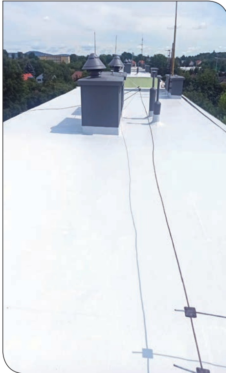
os. Jasne 6 dach po remoncie