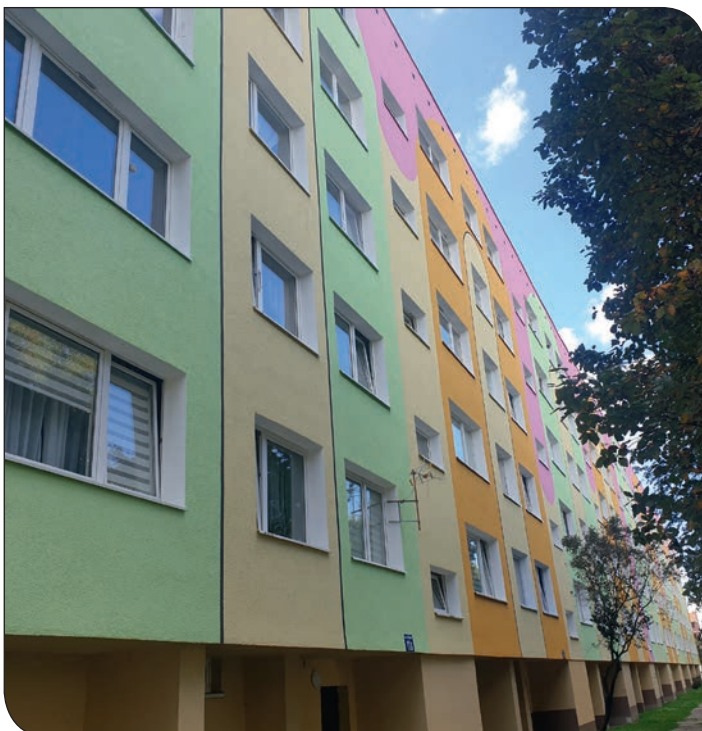
elewacja Różane 11